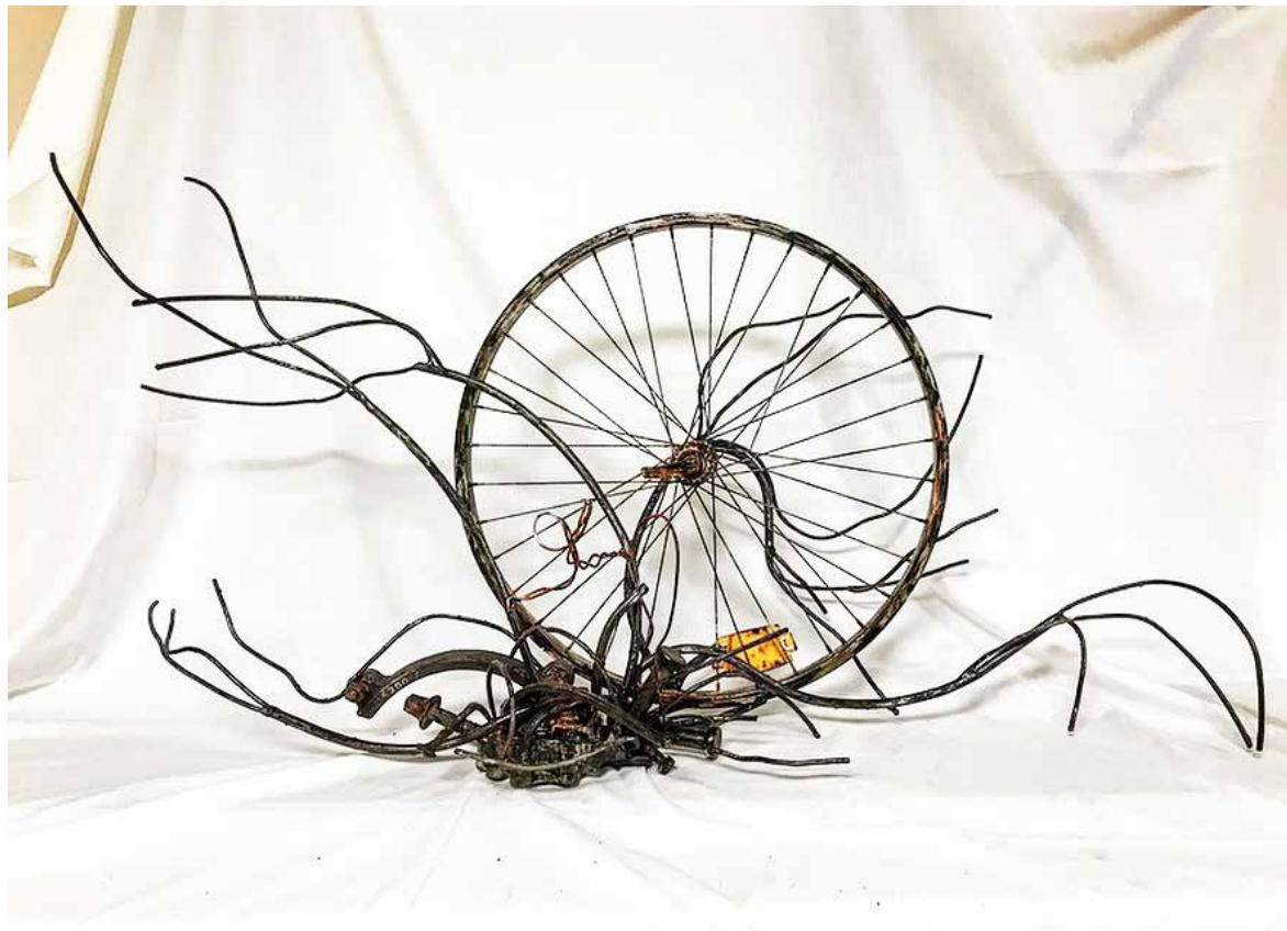
Un paseo por el campo. 80 x 100 cm Hierros, tuercas, tornillos, rueda de bicicleta.

Artista española que da vida al hierro plasmando acciones, emociones y sentimientos. Sus obras se han expuesto en galerías y ferias de España, Alemania, Luxemburgo o Italia. Utiliza materiales reciclados y residuos sólidos que han perdido la utilidad, extrayéndoles toda su fuerza interpretativa y dimensiones ilimitadas.