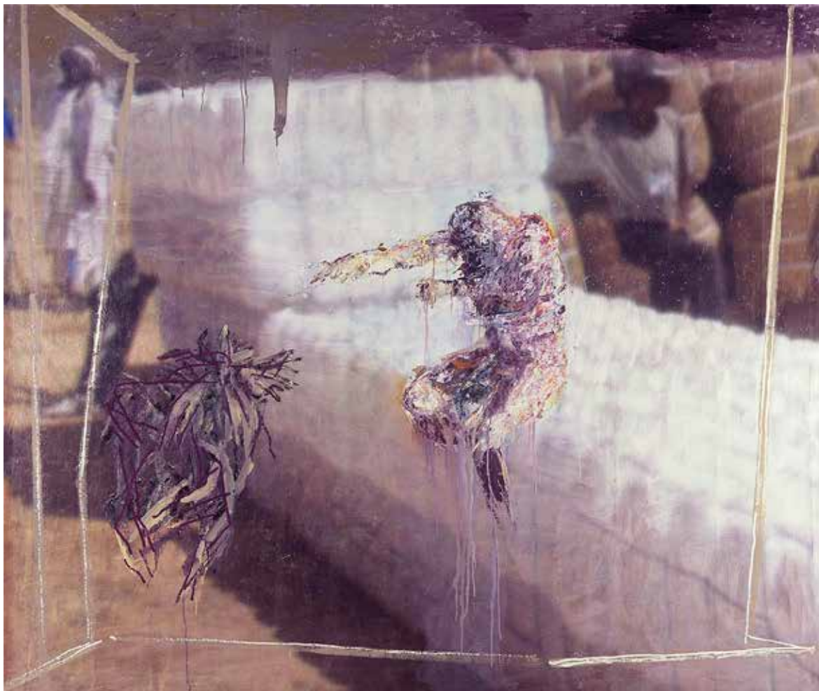
Reflexión II. 200 x 240 cm Óleo sobre lienzo

Artista español doctorado en Bellas Artes por la Universidad de Madrid. Galardonado con numerosos premios, su obra se encuentra en colecciones como el Museo del Barrio en Nueva York, el Museo Bellas Artes en Murcia, ayuntamientos y fundaciones. Profesor emérito de la Universidad de Murcia con varias publicaciones.