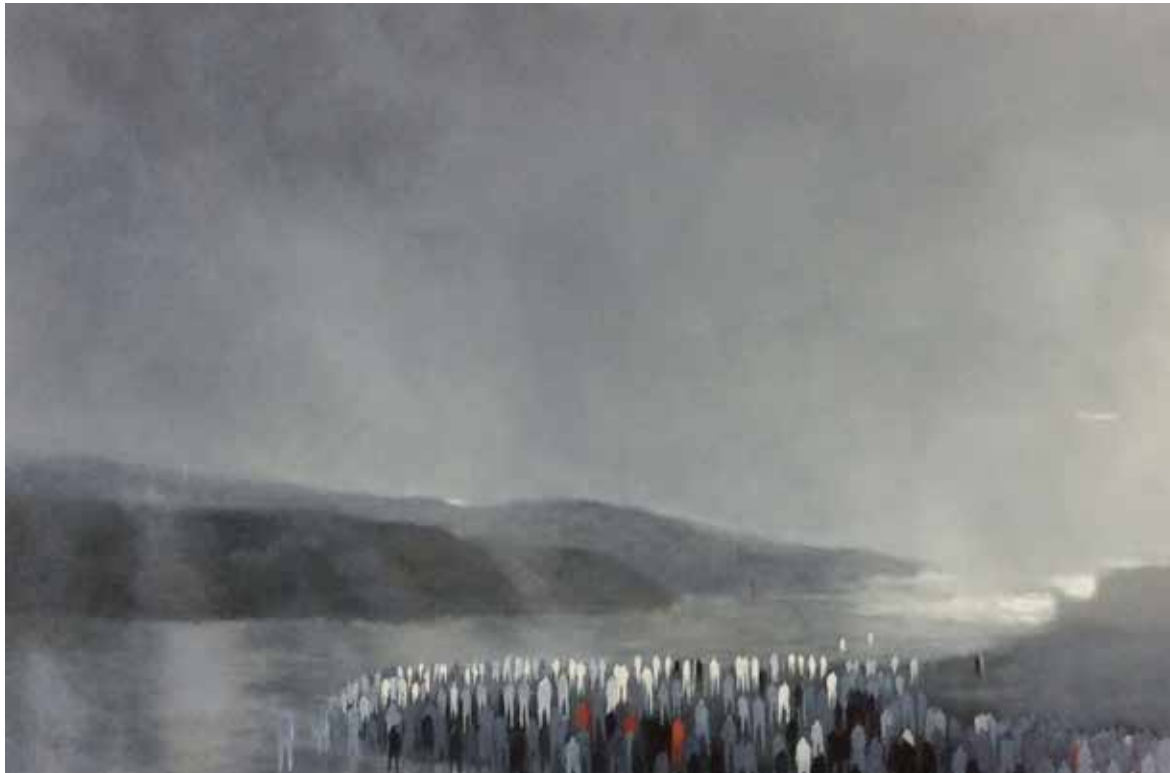
Abandono. 61 x 91 cm Óleo sobre lienzo.

Artista canadiense, estudió Artes Visuales en Quebec. Su extensa trayectoria se ha centrado en Canadá y Estados Unidos, aunque su obra pertenece a colecciones de todo el mundo. Los acontecimientos mundiales, cambio climático, guerra e injusticia dominan su obra, comunicando su percepción del mundo de hoy.