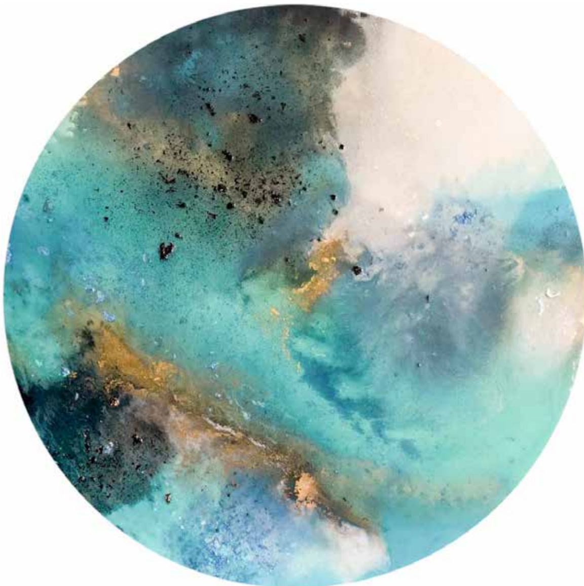
Blue origin XII. 100 cm (diámetro) Técnica mixta sobre madera.

Artista española que explora la naturaleza y la interconexión de todas las cosas. Expresa energía y emoción a través de coloridas pinturas abstractas; su trabajo es intuitivo, emocional, orgánico y espontáneo. Su obra se ha exhibido en ferias y galerías de arte de diferentes provincias de España, además de Suiza.