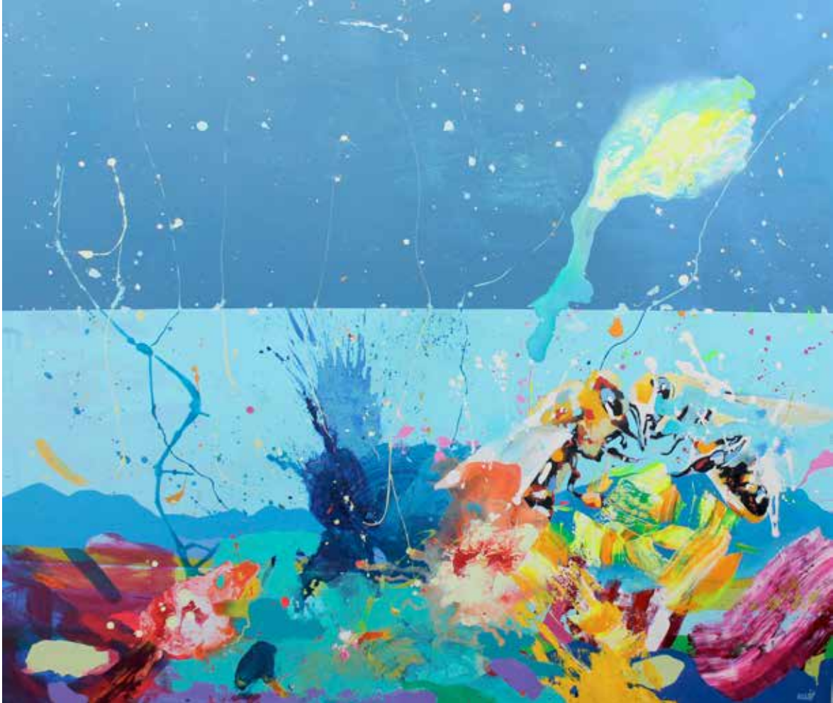
Wandern. 120 x 140 cm Acrílico sobre tela.

Artista español nacido en Australia. Licenciado en la facultad de Bellas Artes de Barcelona, donde también obtuvo su Master. Ha expuesto en diferentes puntos de España y en Turquía. Su arte se inspira en sus continuos viajes, ofreciendo un despliegue de sinfonías cromáticas esenciales que estimulan nuestras emociones.