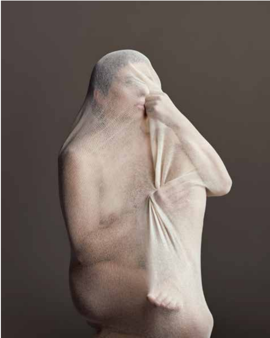
Through the second skin. 125 x 100 cm Impreso en Hahnemühle Gloss Baryta. Edición de 8 + 2ap.

Artista fotógrafo neerlandés, particularmente interesado en la identidad y el comportamiento humano. Pese a su corta carrera ya ha sido varias veces premiado y exhibida en países como Inglaterra, Escocia, Estados Unidos, Italia, Grecia, Corea del Sur y ahora España. Enfrenta la verdadera vulnerabilidad y expresión genuina.