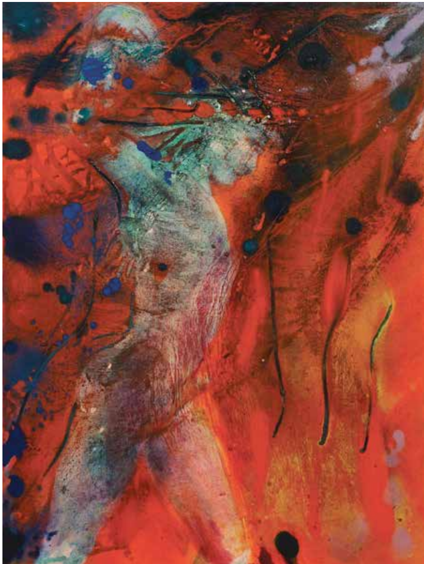
Après-midi d'un Faune. 122 x 92 cm Óleo sobre lienzo.

Nacida en Reino Unido, estudió escultura, anatomía y dibujo en el Sir John Cass College of Art de Londres, y posteriormente Artes Expresivas en Universidad de Brighton. En 2003 se mudó a España para continuar con su arte y exponer en diferentes galerías y ferias del país, además de en Francia y Estados Unidos.