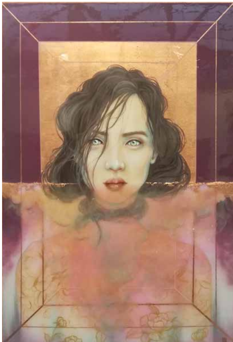
Te voy a dar silencio con la mirada. 100 x 70 cm Múltiples capas de resina, acrílico y láminas de pan de cobre.

Artista española que estudió diseño en Madrid y trabaja como artista tatuadora desde hace más de 10 años. Su obra ha sido expuesta de forma individual y grupal en diversas galerías de España y ferias de arte, como la Feria de Arte de Málaga o la Art Fair Brussels.