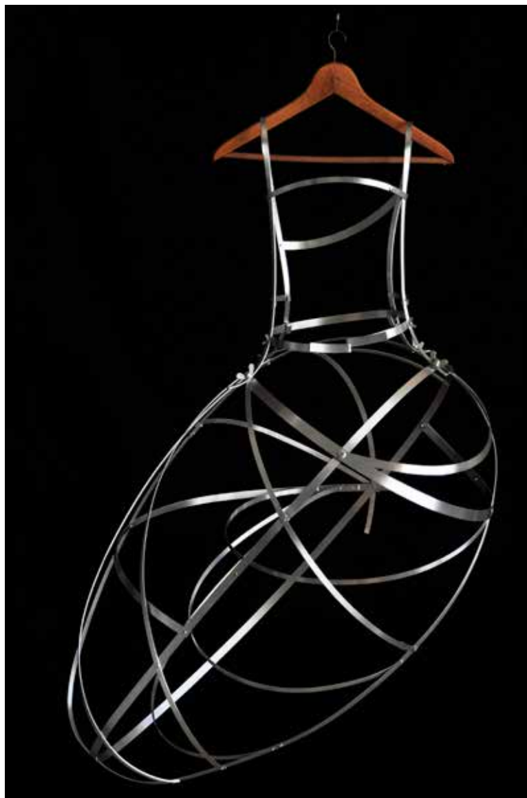
Un vestido para Leda. 140 x 90 x 60 cm Escultura en aluminio. Pieza única.

Nacido en España y licenciado en Bellas Artes por la Universidad de Madrid. Con casi 30 exposiciones por todo el país y galardonado con el 1º premio EAC 2018. En su obra encontramos materiales flexibles con los que, en el ensamblaje de las formas recortadas y tensionadas, crea el juego de líneas que define el espacio.